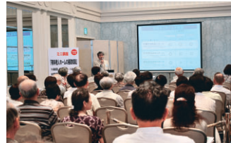
役に立つミニ講座も開催