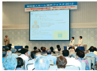
講演会では専門家が、介護・お金・住まいについて分かりやすく解説(写真は前回の様子)